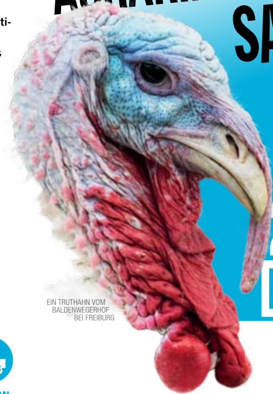
EIN TRUTHAHN VOM BALDENWEGERHOF BEI FREIBURG

12 UHR BERLIN POTSDAMER PLATZ 21.1. 2017 DEMO