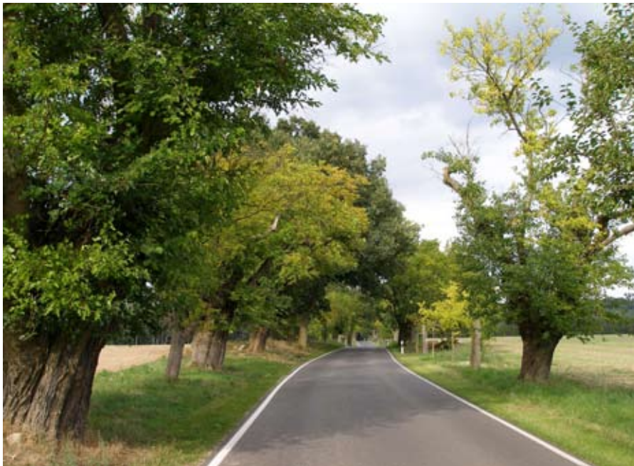
Maulbeerallee in Zernikow