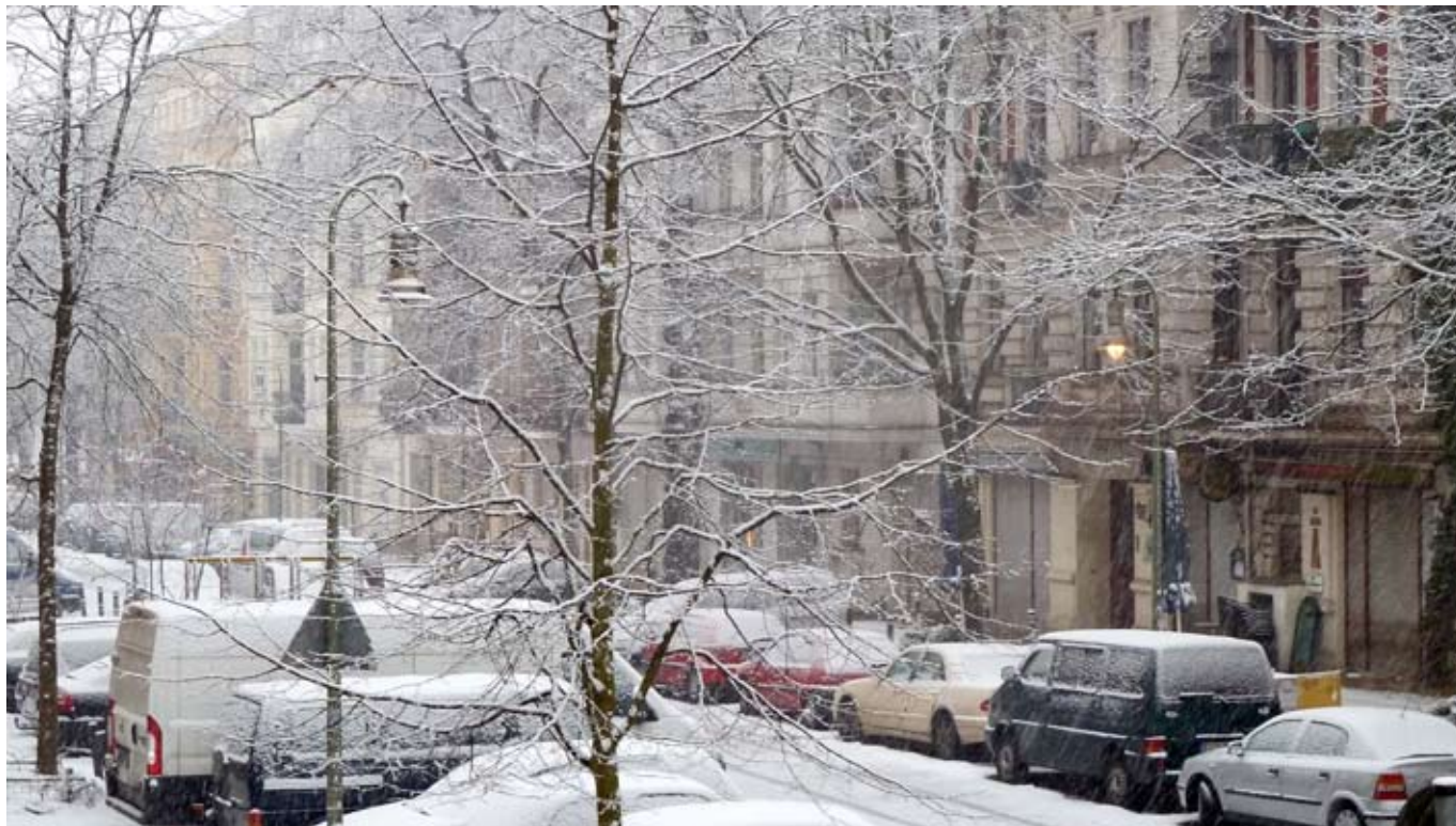
Ostern im Schnee, Berlin 2013