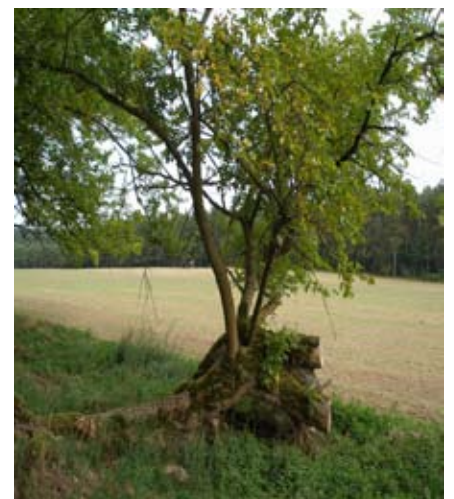
Baum an der Maulbeerallee