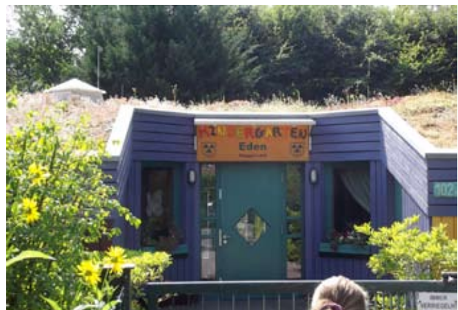
Eingang der Lehmkita in Eden

Der Eden-Betrieb war inzwischen von der nun zuständigen „Treuhand-Anstalt“ stillgelegt, die wesentlichen Teile demontiert und als „hohler Vogel“ der Eden-Genossenschaft gegen Rückzahlung der damaligen „Entschädigung“ und Rückzahlung von Krediten, die der Betrieb in DDR-Zeiten aufgenommen hatte, zurück übertragen. Die Kapitalerlöse wurden langfristig mit gutem Zinssatz angelegt – Silvio Gesell wird sich im Grabe gewälzt haben – und