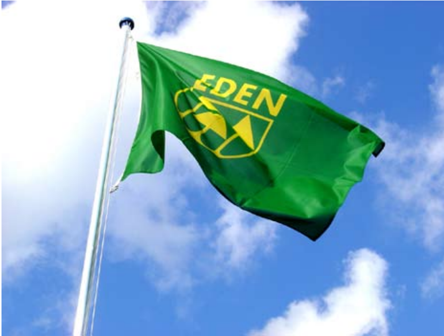
Wehende Fahne mit Eden-Logo