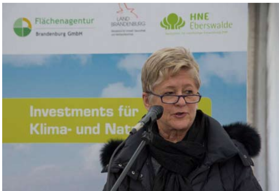
Umweltministerin Anita Tack während der Eröffnungseranstaltung des MoorFutures-Projekt

MoorFutures sind ein innovativer Ansatz zu einer Problemlösung im Sinne eines nachhaltigen Klimaschutzes beizutragen,