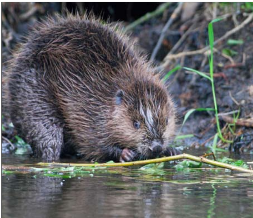
Der Elbebieber war einst fast ausgerottet, heute wird er erneut auf die Abschussliste gesetzt.