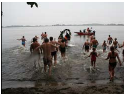
Mutige Teilnehmer beim Sprung in die Havel