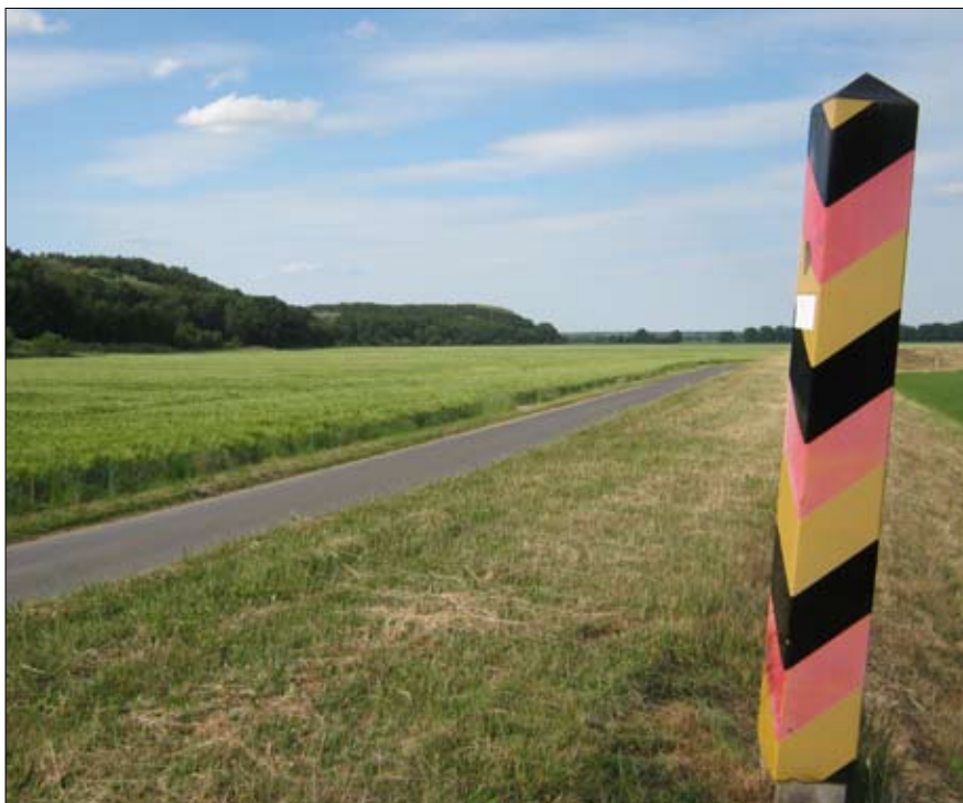
Das Foto zeigt den Blick vom Neiße-Radweg zur Hangkante. Dazwischen soll die überdimensionierte Straße entstehen.