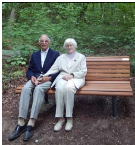
Dr. Casperson und Frau am Tag der Feierstunde