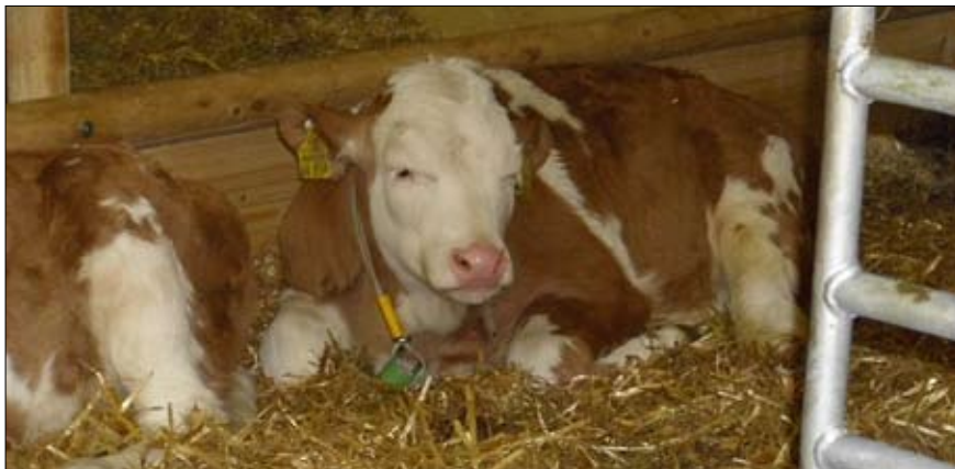
Tierhaltung ist nicht immer Grüne Woche