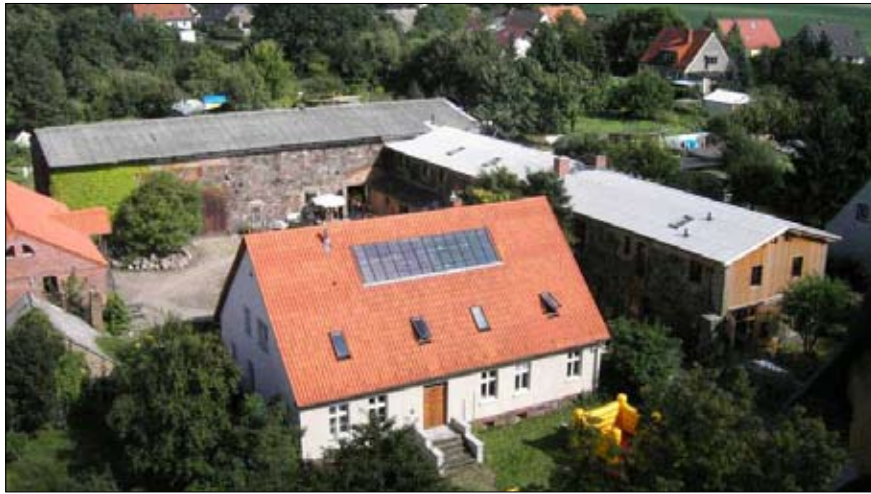
Ein schönes Lufbild vom Ökohof ÖkoLeA in Klosterdorf.

Einstweilen bleibt nur die Möglichkeit, Besseres im kleinen Maßstab zu versuchen. Vor 25 Jahren gründete sich die Grüne Liga ja auch mit dem Vorsatz: „Visionen haben und Netzwerke knüpfen.“ Das tagtägliche Kleinklein der Vereinsarbeit hat leider immer weniger Raum für Visionäres gelassen. Es ist